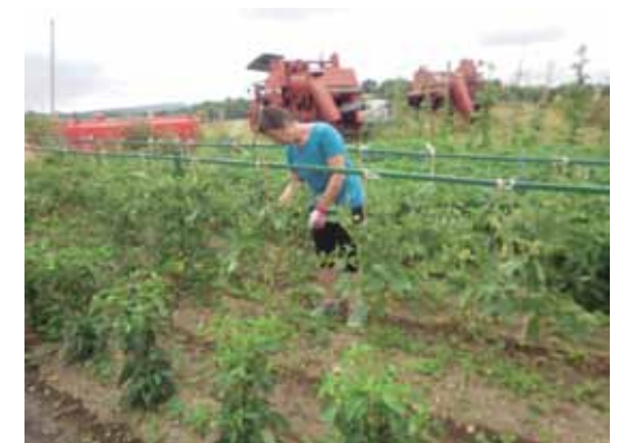
EN LA HUERTA_ 'Dice mi marido que este año tengo la mejor del pueblo, ja, ja, ja, ja!'

Yo creo la mayoría de nuestros vecinos sí que entiende y valora lo que hacemos para conservar el medio rural. Quizás más los nativos, porque conocen mejor nuestro modo de vida.