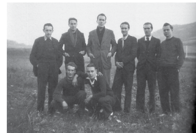
René Char (el capitán Alexandre), el tercero empezando por la izquierda.