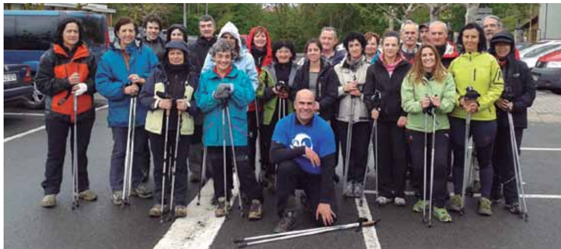
Grupo de iniciación de Zigoitia al Nordic Walking.

Textos e imágenes de www.nordicwalkinggunea.net